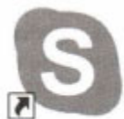
Скюре – Ярлык

7. Сколько всего ярлыков размещено на приведённом фрагменте рабочего стола?